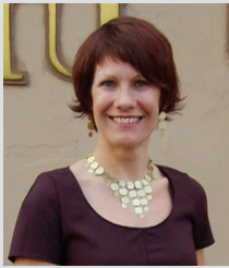
Maia Kurim Riiklik Eksami- ja Kvalifikatsioonikeskus (REKK)

Tööjõu paindlikkust, toimetulekut ja elukestvate õpet tagav haridussüsteem ning selle sisu on üks Euroopa Liidu prioriteetidest. Eesti kutseharidussüsteemi arendamise oluliseks