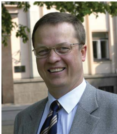
Haridus- ja teadusminister Toivo Maimets