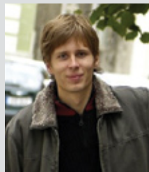
Märt Aro Hariduse ja Arengu Keskus

Neli Taani kõrgkooli ootavad 11 rahvusvahelisele erialale õppima 72 Eesti tudengit. Hariduse ja Arengu Keskus (HAKES) on nende koolidega sõlminud koostöökokkulepped ning samapalju eestlasi ollakse valmis vastu võtma ka järgmistel aastatel. Ka on HAKESi töötajad Taanis kohal käinud, tutvunud pakutavate erialadega ning intervjuuerinud tudengeid, õppejõude ja kooli juhtkonda. Seda kõike selleks, et noortel oleks võimalik saada kvaliteetset teavet oma tuleviku planeerimiseks.